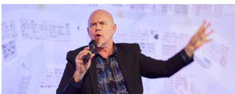
Tad Williams | Lesung und Gespräch mit dem US-amerikanischen Bestsellerautor | In Zusammenarbeit mit dem Dragon Days Festival