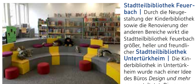
Lampen passen sich automatisch ans Tageslicht an und tragen zu einer angenehmen Raumbelichtung bei. Besonders für Kinder ist die neue Kindertreppe inmitten des Raumes ein attraktiver Aufenthaltsort.

75 Jahre Stadtbibliothek Vaihingen | Ausstellung mit Dokumenten, Fotos, Erinnerungen an 75 Jahre Stadtbibliothek in Vaihingen und Ausblicke auf die Bibliothek von morgen. Die Hochschule der Medien zeigt KinderMedienWelten früher und heute | Am Zukunftsaktionstag gaben Auszubildende der Stadtbibliothek Einblicke in neue Techniken und Andrea Wardzichowski vom Chaos